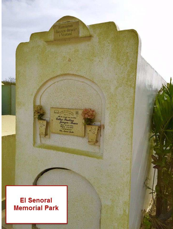
El Senoral Memorial Park