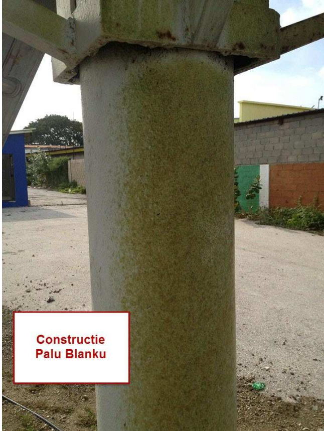
Constructie Palu Blanku