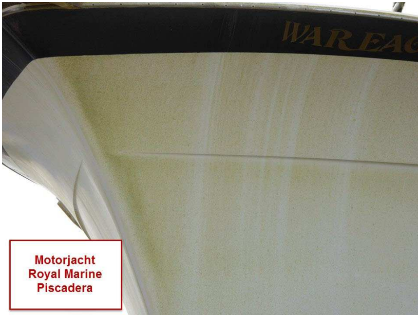
Motorjacht Royal Marine Piscadera